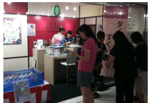
昨年の開催写真(東京駅八重洲地下街)

参加は無料、女性のお客様限定となります。(ご同伴のお子様もご参加いただけます。)