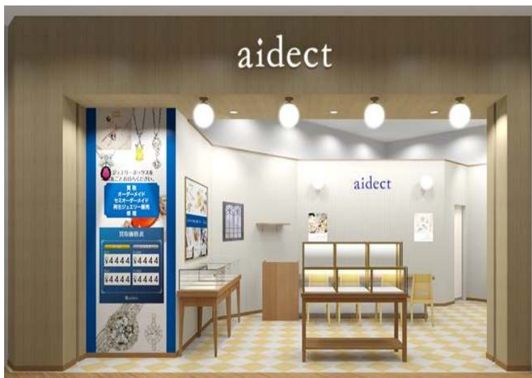
『アイデクト ららぽーと和泉店』店舗イメージ

保有ジュエリーの資産価値向上を提案する「ジュエリープランナー」の株式会社アイデクト(本社:東京都千代田区、代表取締役社長:藤野匡生)は、2014年10月30日に『アイデクト ららぽーと和泉店』をオープンします。