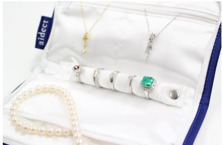
左からベージュ×ベビーピンク、ネイビー×ホワイト